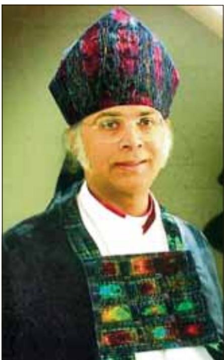
ADVARER: Pakistanskfødte Nazir-Ali var inntil nylig biskop i den anglikanske kirka. Allerede for tre år siden advarte han mot at æresdrap på kristne eksmuslimer kan skje.

«Biskop Michael håper å få arbeide med flere kirkeledere fra områder hvor kirka er under press, særlig i mi-